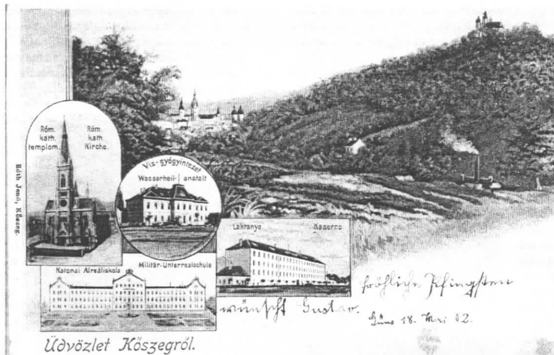
A hidegvíz-gyógyintézet Kőszeg nevezetességei között a várost bemutató képeslapon (1900 körül)